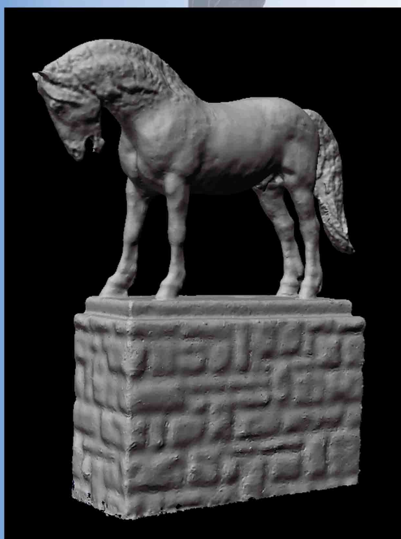
Zaplochovaný polygonový 3D model

Výsledkem je zhlazený zaplochovaný virtuální 3D model, který je tvořen z 670 000 bodů, z nichž je vygenerováno 1 337 000 trojúhelníků.