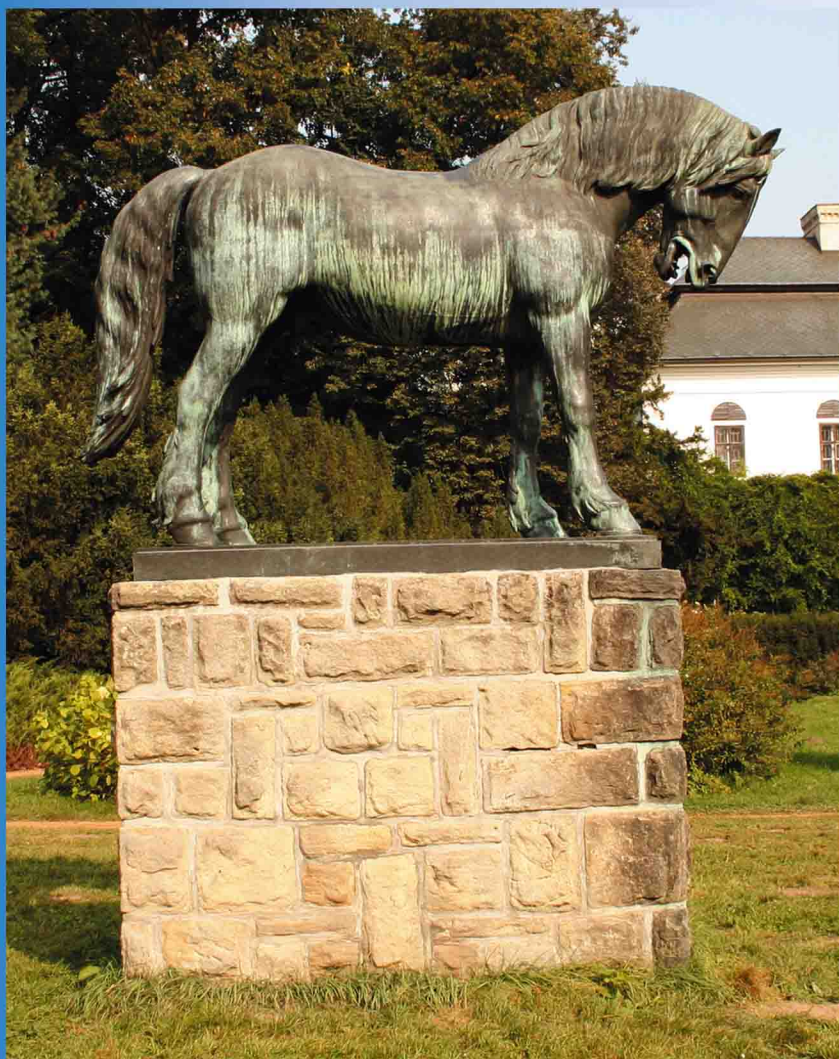
Socha koně v zámeckém parku

V roce 1951 byla v zámeckém parku ve Slatiňanech instalována bronzová socha koně od profesora Bohumila Kafky, která byla předlohou pro koně největší bronzové jezdecké sochy na světě – sochy Jana Žižky na pražském Vítkově. Modelem pro koně byl Slezský norik jménem Albín Theseus.